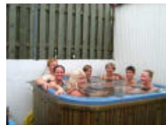
Hof Egilsstaðir I am Ufer der Thjórsá: Farmhaus, Ferienhaus, FH Innenansicht, Frühstücksbuffet, der HotPot, die Gastgeberfamilie (unten)