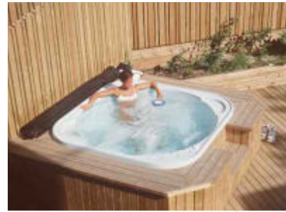
Typisch isländischer HotPot im Garten

Zu all diesen Vorzügen kommen äußerst günstige Winterpreise, die besonders einen längeren Aufenthalt in Reykjavík interessant und erschwinglich machen.